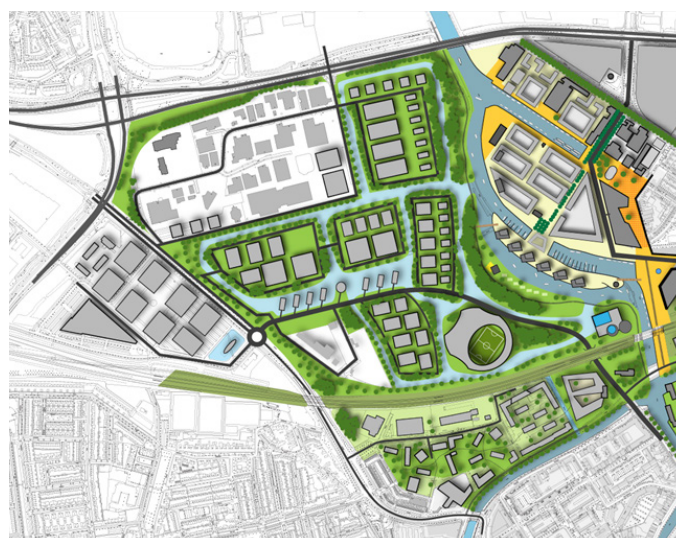
@Hans Thoolen - Ville de Breda

Le projet est pensé en grande partie pour / par le transport : nouvelle gare, multifonctionnelle (logements, bureaux, grands parkings voiture/vélo) avec une volonté de faire un paysage ferroviaire le long de la ligne, utilisation des lignes ferroviaires existantes pour créer le paysage.