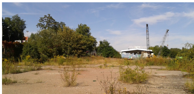
AVANT TRAVAUX - 2012