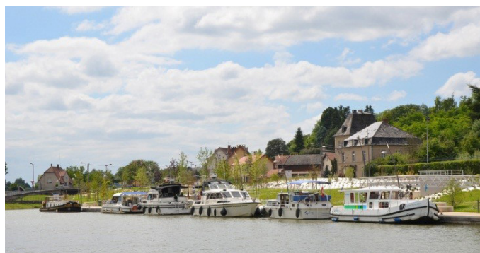
APRES TRAVAUX - 2014